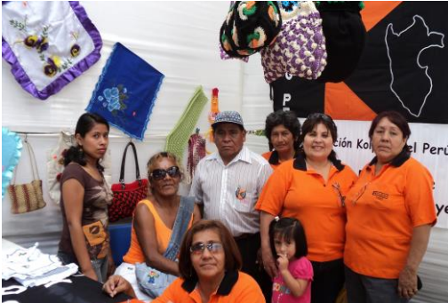
Diese Gruppe stellt erfolgreich selbst produzierte Ware her wie Taschen, Decken und Kissen.

KOLPING INTERNATIONAL will durch seine Projektarbeit die Armut bekämpfen und Menschen befähigen, sich selbst zu helfen. Dies geschieht durch Aus- und Weiterbildung, Kleingewerbeförderung und Maßnahmen in der ländlichen Entwicklung.