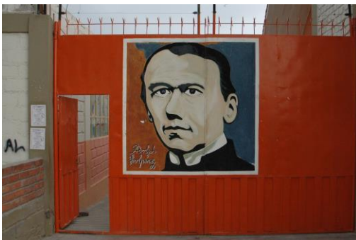
Eingang der Kolping-Schule in Arequipa.

Die Kolpingsfamilien starten immer wieder eigene Projekte und Kampagnen, um die Probleme in ihrem sozialen Umfeld zu lösen. Durch die Kooperation mit anderen Einrichtungen und Institutionen im Land ist Kolping gut vernetzt und kann in Peru vieles bewegen.