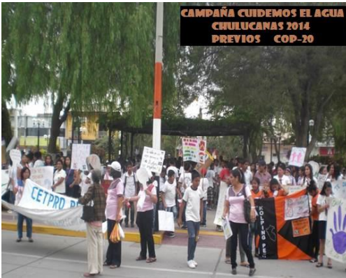
Wasserkampagne Kolping Peru 2014

Das Kolpingwerk Peru möchte einen Beitrag zum Aufbau der Zivilgesellschaft dort leisten. Es beteiligt sich deshalb aktiv an Kampagnen, die Missstände im Land bekämpfen wollen.