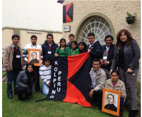
Die Kolpingsfamilie Chepén.

Die Aktivitäten des Verbandes zielen darauf ab, Hilfe zur Selbsthilfe zu leisten, damit die Menschen ihre Alltagsprobleme bewältigen können. Dies geschieht u.a. durch Maßnahmen der Aus- und Fortbildung, Initiativen zur ländlichen Entwicklung, den Aufbau von Kleinstunternehmen oder durch das Prinzip des gemeinschaftlichen Wirtschaftens (Stichwort: Economía Solidaria ).