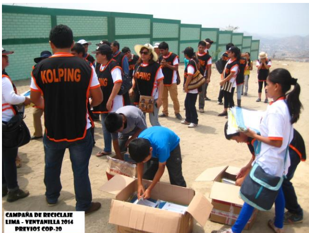
Umweltschutzkampagne von Kolping in Lima.

In den allermeisten Fällen müssen sich die Kolping-Mitglieder aber erst befähigen, tatsächlich aktiv zu werden und Probleme anzugehen.